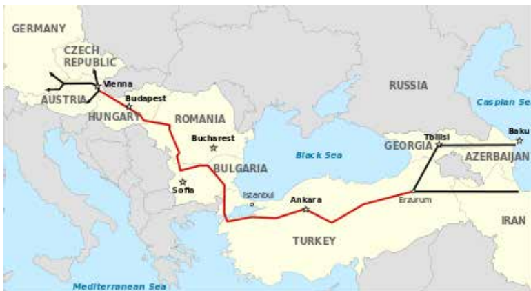
Percorso del gasdotto Nabucco

Il gasdotto Nabucco è un progetto volto alla realizzazione di una nuova via di importazione del gas naturale proveniente dalla zona del Caucaso, del Mar Caspio e, potenzialmente, del Medio Oriente. Avrebbe dovuto collegare la Tur-